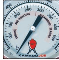
Thermomètre avec guide de cuisson