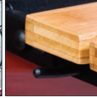
Tiges pour les ustensiles