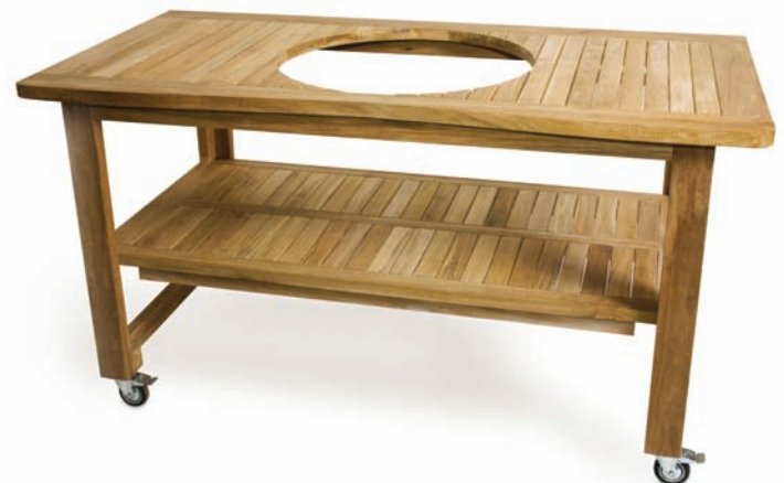
TABLE POUR LE GRILL EN BOIS DE TECK

Nos tables en acier inoxydable sont le summum de l'élégance et de la résistance. Fabriquée en acier inoxydable brossé (304#4) avec tablettes pliantes, roulettes avec freins pour une plus grande stabilité ainsi qu'un espace de rangement spacieux.