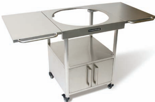
TABLE POUR LE GRILL EN ACIER INOXYDABLE

Nos tables en acier inoxydable sont le summum de l'élégance et de la résistance. Fabriquée en acier inoxydable brossé (304#4) avec tablettes pliantes, roulettes avec freins pour une plus grande stabilité ainsi qu'un espace de rangement spacieux.